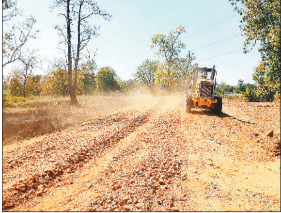
निर्माणाधीन सड़क में काम करते लोग।

इन सड़कों के पूर्ण होने से संबंधित बसाहटों के साथ साथ आसपास के क्षेत्रों के लोगों को प्रत्यक्ष लाभ मिलेगा। किसानों को अपनी उपज मंडियों तक सहज पहुंच प्राप्त होगी, जिससे उनकी आय में वृद्धि होगी। बच्चों के लिए विद्यालय तक पहुंच आसान होगी, गर्भवती महिलाओं एवं मरीजों को समय पर स्वास्थ्य सुविधाएं उपलब्ध हो सकेंगी और आपातकालीन सेवाएं अधिक सुदृढ़ होंगी। बेहतर सड़क संपर्क से आर्थिक, सामाजिक और शैक्षणिक गतिविधियों को नई गति मिलेगी तथा जिले के दूरस्थ अंचलों में जीवन स्तर में