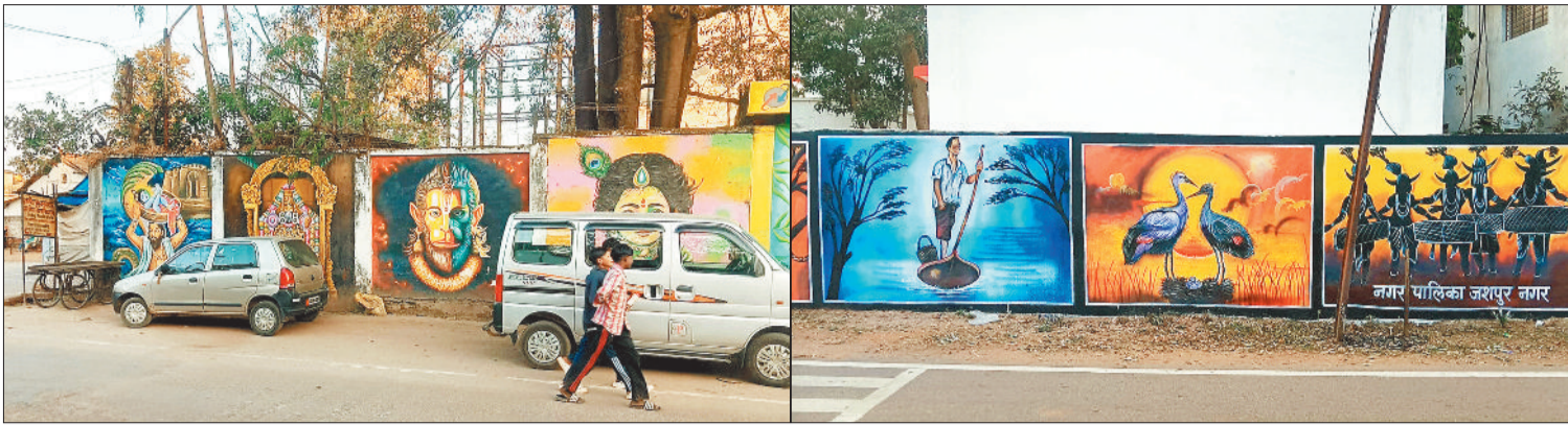
हरिभूमि न्यूज ►► जशपुरनगर